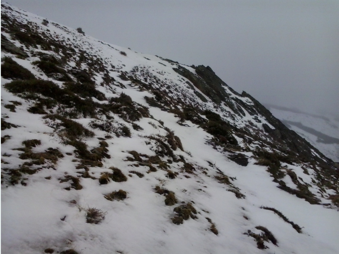
Camino de El Puntal de las Cazoletas. Sierra Nevada (Granada, España).