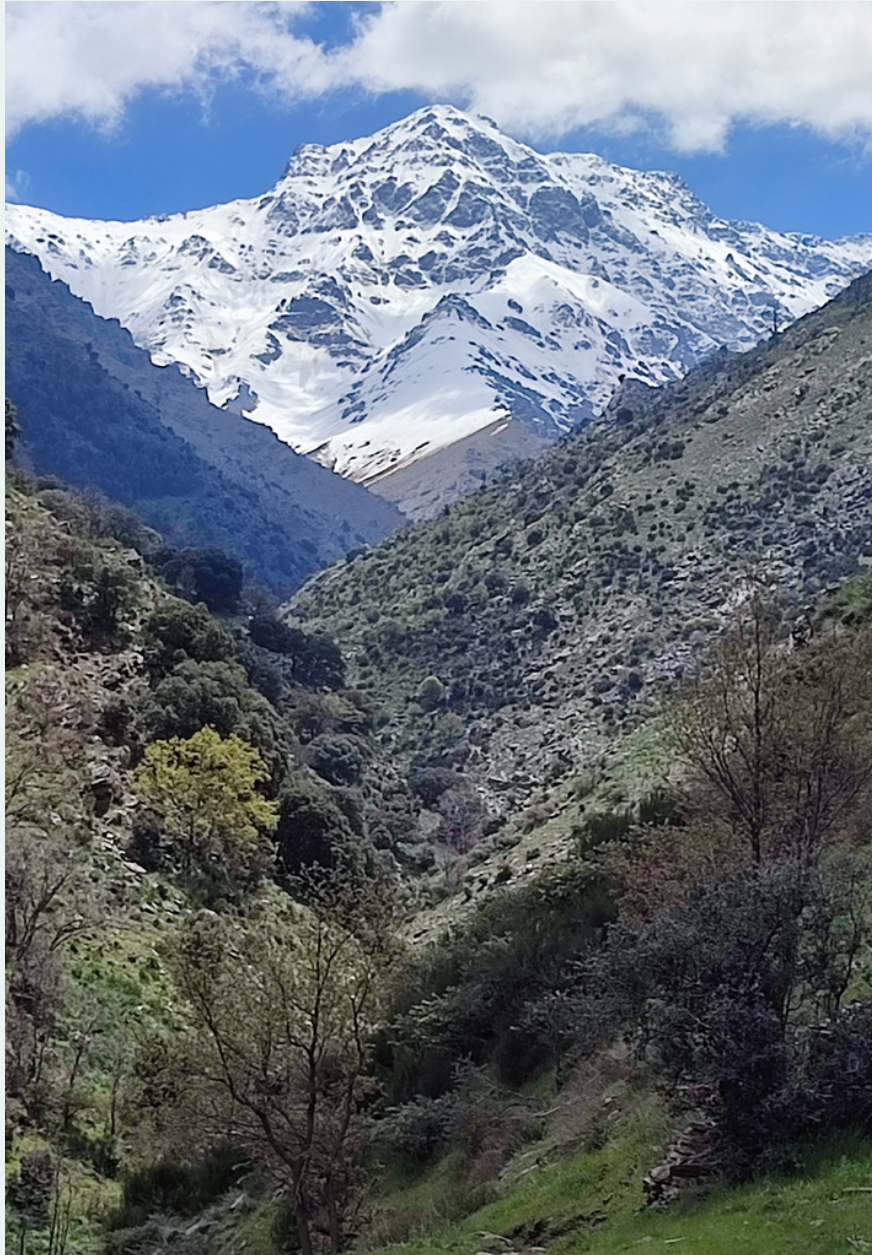
La Alcazaba, la dama de la montaña, Sierra Nevada (Granada, España).

Es la pureza del aire que respiro, el encuentro gozoso con otros seres que aparecen y se van, la presencia profunda de los árboles, la caricia consentida de los matorrales , la fuerza infinita de las piedras que sienten mi transitar.