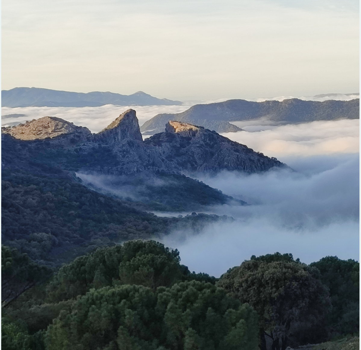
El Salto del Cabrero, Grazalema (Cádiz, España).