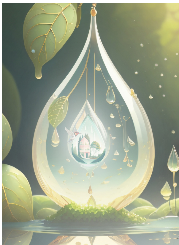
Ilustración de @aaron.agivala